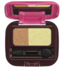
フローラルアイパレット