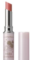
なめらかスマートリップ