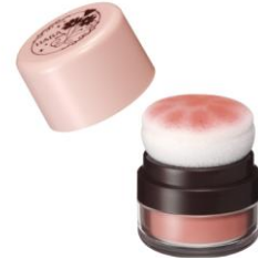
ふんわり ポンポンチークⅡ