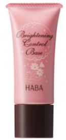
顔色アップしっとりベース