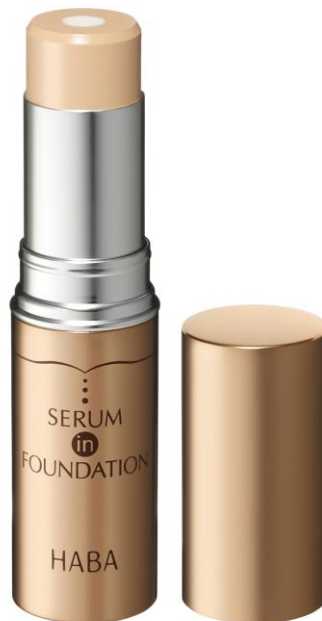
『セラムイン ファンデーション』

株式会社ハーバー研究所(所在地:東京都千代田区)は、2層構造の中心層に4種のうるおい成分を凝縮した、スティックタイプのファンデーション『セラムイン ファンデーション』を2014年1月6日(月)より、全国のショップハーバー、通信販売およびインターネットにて数量限定で新発売いたします。