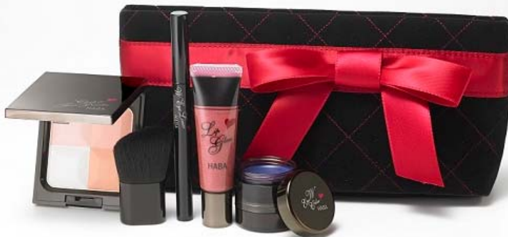
商品名:『ドラマティックコレクション』 価格:6,264円(税込)

株式会社ハーバー研究所(所在地:東京都千代田区)は、2014年冬の限定コフレ『ドラマティックコレクション』(5アイテム/ポーチ付)を、10月31日(金)より全国のショップハーバー、通信販売およびインターネットにて数量限定で新発売いたします。