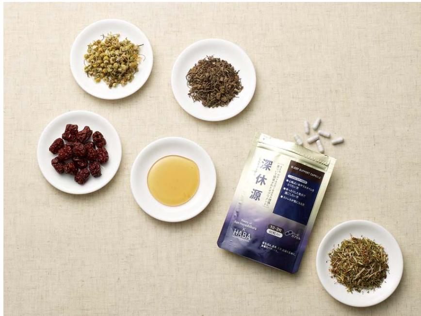
商品名：「深休源」／容量：60 粒（30 日分）／価格：税込 3,024 円

株式会社ハーバー研究所（所在地：東京都千代田区）は 2015 年 4 月 3 日（金）より、心地よいおやすみタイムをサポートする休息サプリメント『 しんきゅうげん 深休源』を全国のショップハーバー、通信販売およびインターネットにて新発売いたします。