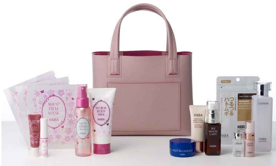
『'16 ハッピーフラワー福袋』 価格：10,800円(税込) ※化粧水がGローションの場合の価格

株式会社ハーバー研究所(所在地:東京都千代田区)は、毎年大好評のお得な福袋『'16 ハッピーフラワー福袋』を2015年11月1日より、全国のショップハーバー、通信販売およびインターネットにて予約受付を開始いたします。