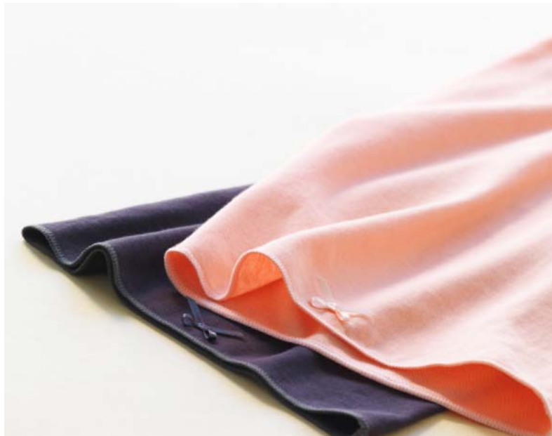
『遠赤ボディウォーマー』 全2色 価格：各1,800円（税別）

株式会社ハーバー研究所（所在地：東京都千代田区）は、2016年10月25日（火）より、遠赤外線効果で体をしっかり温める腹巻き『遠赤ボディウォーマー』（全2色 各税別1,800円）を、全国のショップハーバー、通信販売およびインターネットにて数量限定で新発売いたします。