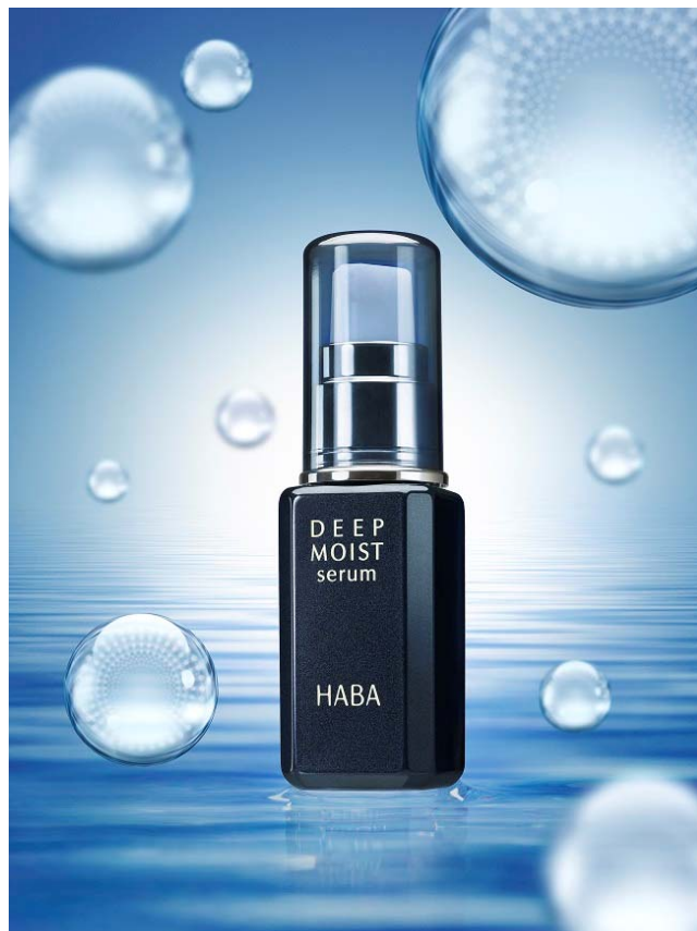
『ディープモイストセラム』 30mL 価格：3,600円（税別）

株式会社ハーバー研究所（所在地：東京都千代田区）は、2017年9月26日（火）より“速攻×持続”の高保湿美容液『ディープモイストセラム』を、全国のショップハーバー、通信販売および公式オンラインショップにて新発売いたします。