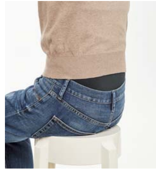
【グレー】 チラッと見えても、下着に 見えず安心