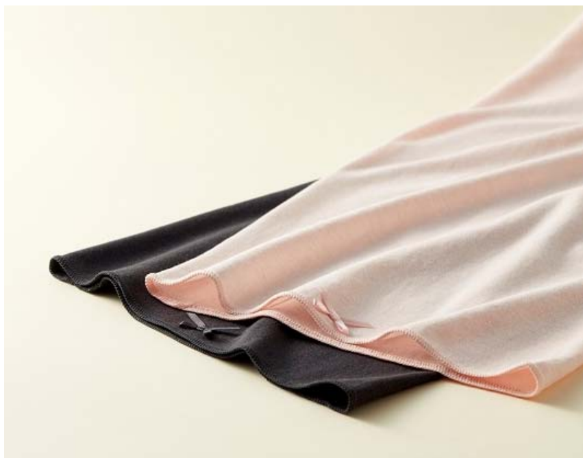
『遠赤ボディウォーマー』 全2色 価格：各1,944円（税込）

株式会社ハーバー研究所（所在地：東京都千代田区）は、2017年10月26日（木）より、昨年大人気だった、遠赤外線効果で体をしっかり温める腹巻き『遠赤ボディウォーマー』（全2色 各税込1,944円）を、全国のショップハーバー、通信販売およびインターネットにて数量限定で新発売いたします。