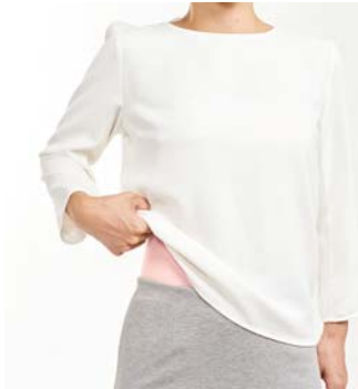
【ベビーピンク】 淡色の洋服を着た時も 目立ちにくいカラー