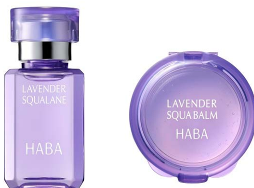
『ラベンダースクワラン&ラベンダー海の宝石セット』 2,160円（税込）

株式会社ハーバー研究所（所在地：東京都千代田区）は、創業35周年を記念してラベンダー精油をプラスした美容オイルと練り状スクワランのセット『ラベンダースクワラン&ラベンダー海の宝石セット』を、2018年7月24日（火）より、通信販売および全国のショップハーバーにて数量限定で新発売いたします。