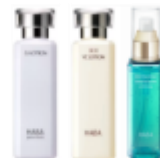
G LOTION VC LOTION RAL LOTION