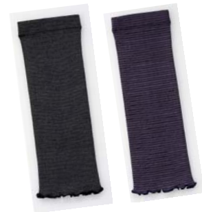
『遠赤手首・足首ウォーマー』

株式会社ハーバー研究所（所在地：東京都千代田区）は、2018年10月25日（木）より、遠赤外線効果で手首・足首をしっかりと温める、冷え対策アイテム『遠赤手首・足首ウォーマー』（全2色 各税込1,944円）を、通信販売および全国のショップハーバーにて数量限定で新発売いたします。