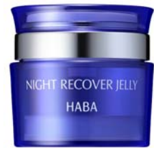
『ナイトリカバージェリー』 4,000円（税別）

株式会社ハーバー研究所（所在地：東京都千代田区）は、夜用ジェル美容液『ナイトリカバージェリー』を2019年1月22日（火）より、通信販売および全国のショップハーバーにてリニューアル新発売いたします。ぷるんとしたジェリーのようなテクスチャーの『ナイトリカバージェリー』は、スパチュラに取ってご使用いただいておりますが、この度エアレスジャー容器に変更。ワンプッシュで1回分を取り出すことができ、利便性を高めました。