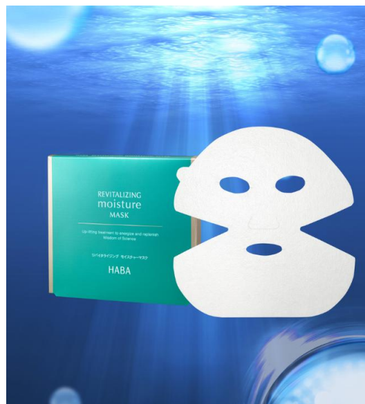
『リバイタライジング モイスチャーマスク』(高保湿エイジングケアマスク) 5包セット 3,200円 (税別)

株式会社ハーバー研究所(所在地:東京都千代田区)は、年齢肌に必要な保湿機能と浸透性に特化した、高浸透エイジングスキンケアライン「RMシリーズ」の新たなラインナップとして『リバイタライジングモイスチャーマスク』(高保湿エイジングケアマスク)を2018年11月21日(水)より、アジアを中心とした海外の店舗及び国内では限定4店舗にて発売いたします※3。