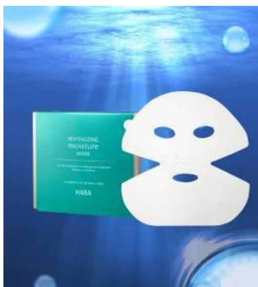
『HABA 海洋倾注赋活面膜』(高保湿抗衰老面膜)5 片/盒 3,200 日元（不含税）

由株式会社 HABA 研究所（所在地：东京都千代田区）专为改善熟龄肌肤所需保湿功能和渗透性而研发的高渗透抗衰老产品线“RM 系列”，现已隆重推出新款产品——“HABA 海洋倾注赋活面膜”（高保湿抗衰老面膜），并将于 2018 年 11 月 21 日（周三）起在以亚洲为中心的海外店铺和国内 4 家限定店铺全新上市※3。