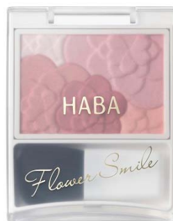
「フラワースマイルチーク」 全2種 各2,100円（税別）