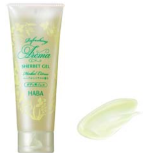
『さわやかハーバルシャーベットジェル<ハーバルシトラスの香り>』 1,800円(税別)

株式会社ハーバー研究所(所在地:東京都千代田区)は、爽やかな清涼感をもたらすボディジェル『さわやかハーバルシャーベットジェル<ハーバルシトラスの香り>』を、2019年6月24日(月)より通信販売および全国のショップハーバーにて数量限定で発売いたします。『さわやかハーバルシャーベットジェル<ハーバルシトラスの香り>』は、保湿成分や皮膚コンディショニング成分を贅沢に配合し、紫外線による肌ダメージに対応。ジェルによる肌表面温度マイナス5℃の清涼感で、汗ばむ季節も快適にお肌をケアします。また、天然精油のライム・グレープフルーツ・ラベンダー・レモングラスを使用した爽やかな香りで、気分もリフレッシュ&リラックス。