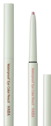
『ウォータープルーフアイカラーペンシル』 各 2,000 円（税別）

『ウォータープルーフアイカラーペンシル』は、春のハッピーメイクのポイントとなる、春の揺らぎ肌や、花粉の時期の涙目にも負けないアイカラー。汗、皮脂、涙に強く、こすっても崩れない、ウォータープルーフ処方、きれいなアイメイクをキープします。クリームのように柔らかでなめらかに伸び、ぼかしも簡単。アイライナーとしても、アイカラーとしても使えます。