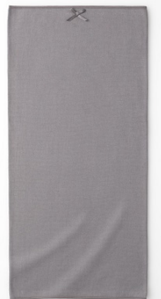
『遠赤ボディウォーマー』 1,980円（税込）

長さが51cmのロングサイズで、胸からお尻まで広範囲にカバー。二重に折ってお腹まわりを集中的に温めることも可能です。薄手で伸縮性抜群なのでアウターにひびかず、すっきり着こなせ、体にやさしくフィットするので、心地よくお使いいただけます。