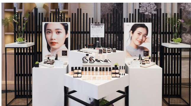
無添加スキンケアメイクリニューアル商品ディスプレイ

「美容液級処方で、肌が呼吸するような使い心地となめらかな仕上り、メイクでシワ改善・美白※4を叶え、潤い・キメも整える喜びの肌体験を”コンセプトに無添加※1、ミネラルカラー（無機顔料）※2であることはもちろん、8アイテムを医薬部外品とし、美容液処方技術を全品に取り入れました」と語り、特に長年蓄積された研究データのもと、厳選した安全かつ美肌力を高める機能性成分「スパークルナイアシン（※スクワランも含む）」を配合した点、環境配慮パッケージを取り入れ、カラーバリエーションも豊富な各メイクアイテムについて解説しました。