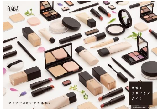
2024年1月22日(月)リニューアル発売の無添加スキンケアメイク

■会場: ザ スtrings表参道 地下1F イーストスイート(東京都港区北青山3-6-8)